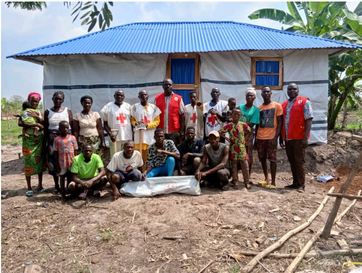
Construction Abris témoins

Actuellement les communautés sont de retour dans les ménages mais la majorité vivent auprès des familles d'accueil.