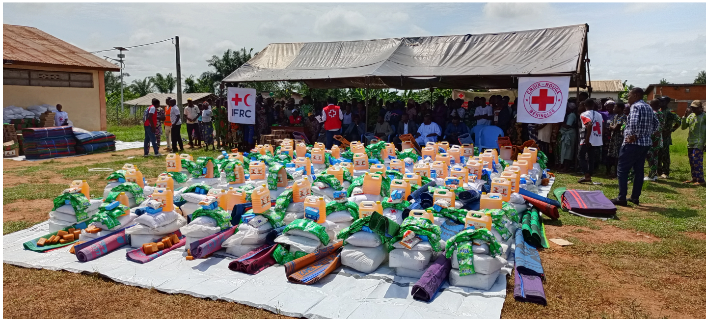
Mise en place des kits pour la distribution