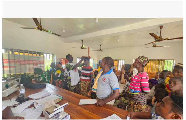
stratégies avancées des services de santé